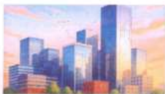
building مبنى / بناء