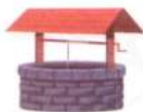
well بئر مياه